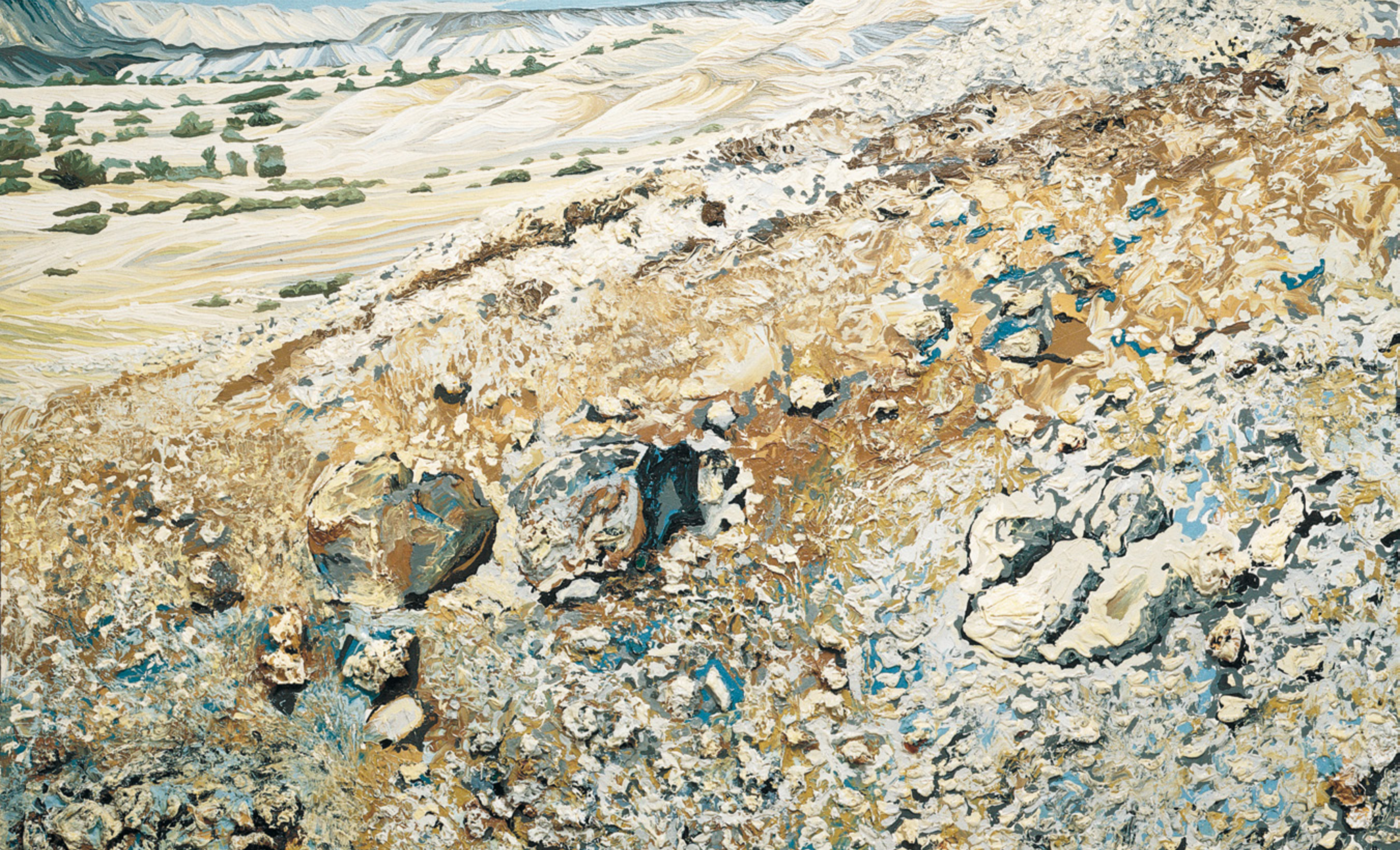
יונה לוי גרוסמן, 133, תשמ"ט, שמן על בד