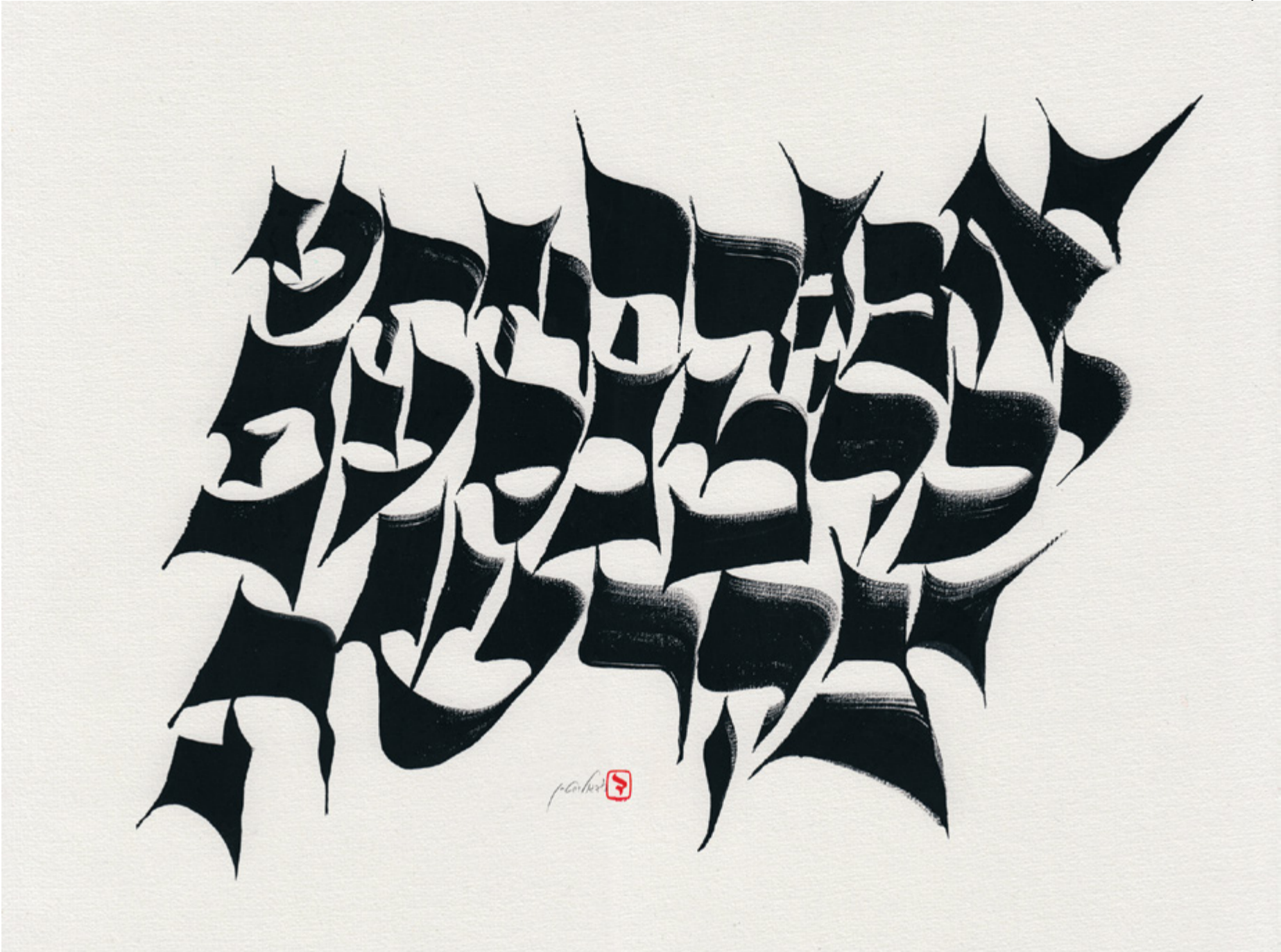
דוד גולדשטיין, וריאציה על אלפבית אשכנזי - קומפוזיציה חופשית, תשפ"א, דיו על נייר